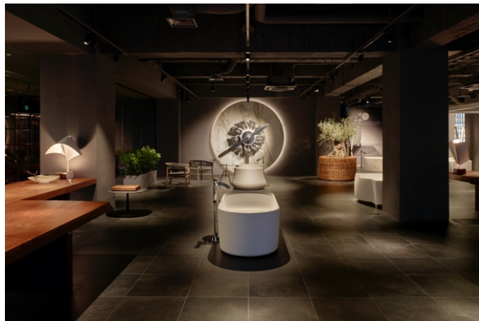
HIDEO ブランド旗艦ショールーム“HIDEO TOKYO”

JAXSON 創業者である清水秀男が 40 年間にわたり培ってきたバスタブデザインと最先端の製造技術、新素材をもって開発した置き型バスタブコレクションを製造販売する会社として 2018 年に設立。