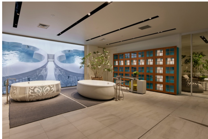
JAXSON ブランド旗艦ショールーム“JAXSON TOKYO”